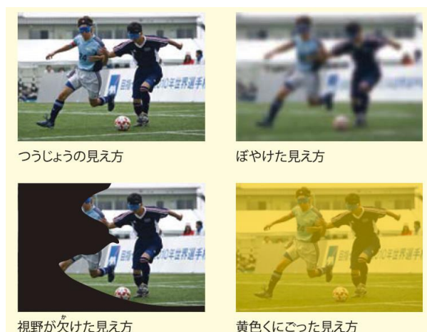
つうじょうの見え方